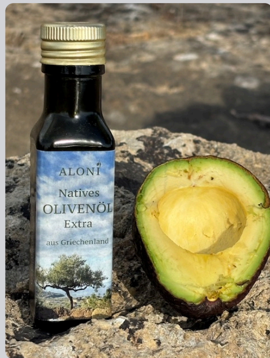
Olivenöl und Avocado