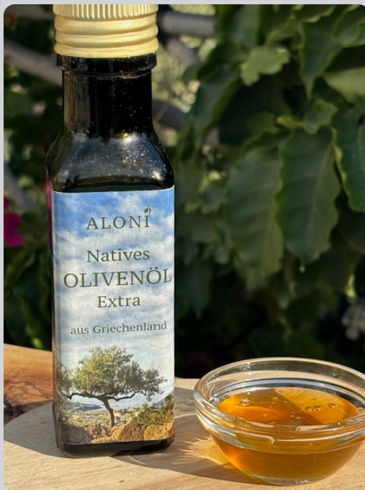
Olivenöl und Honig