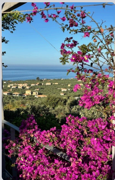
Bougainvillea mit Blick auf Agios Nikolaos

Das war's mal wieder von uns aus Griechenland. Wir wünschen euch schöne und entspannte Spätsommertage.